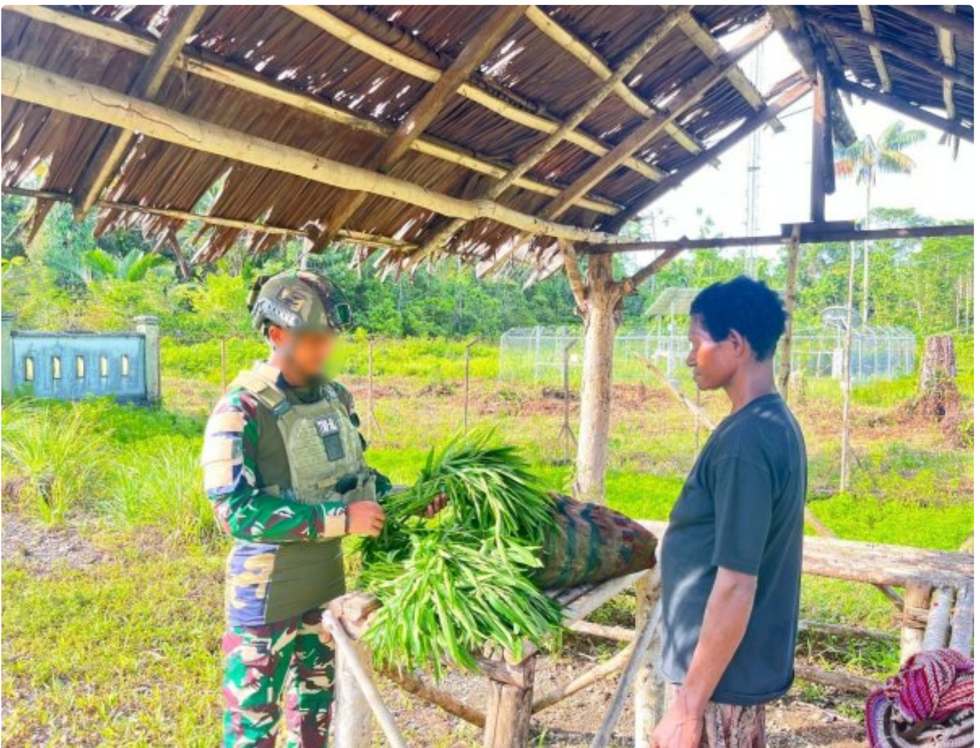
Foto: Prajurit TNI Angkatan Laut mampu menghadirkan senyum dan harapan bagi masyarakat dengan memborong hasil tani masyarakat Kampung Keikey, Kabupaten Yahukimo. Pada Rabu (4/2/2026).

YAHUKIMO- Di tengah keheningan pedalaman Papua, tepatnya di Kampung Keikey, Kabupaten Yahukimo, sebuah aksi sederhana dari prajurit TNI Angkatan Laut mampu menghadirkan senyum dan harapan bagi masyarakat. Pada Rabu