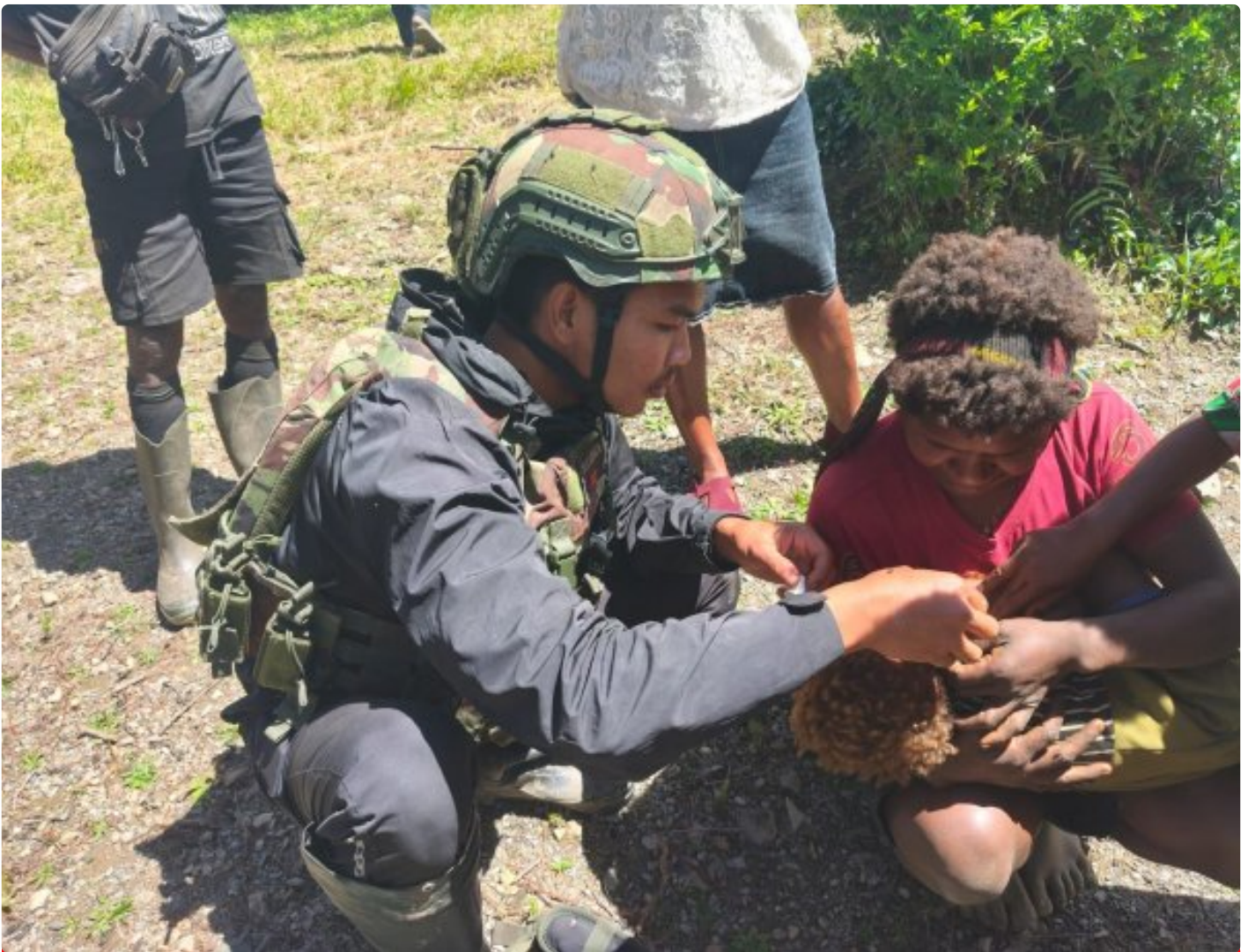
Foto: Prajurit TNI Satgas Pamantas RI-PNG Mobile Yonif 113/Jaya Sakti (JS) Pos Maya menghadirkan pelayanan kesehatan secara door to door di Kampung Ogeapa, Distrik Homeyo, Kabupaten Intan Jaya, Jumat (20/2/2026).

INTAN JAYA- Akses layanan kesehatan yang terbatas di wilayah pedalaman Papua Tengah mendorong Satgas Pamantas RI-PNG Mobile Yonif 113/Jaya Sakti (JS) Pos Maya menghadirkan pelayanan kesehatan secara door to door di Kampung Ogeapa, Distrik Homeyo, Kabupaten Intan Jaya, Jumat (20/2/2026).