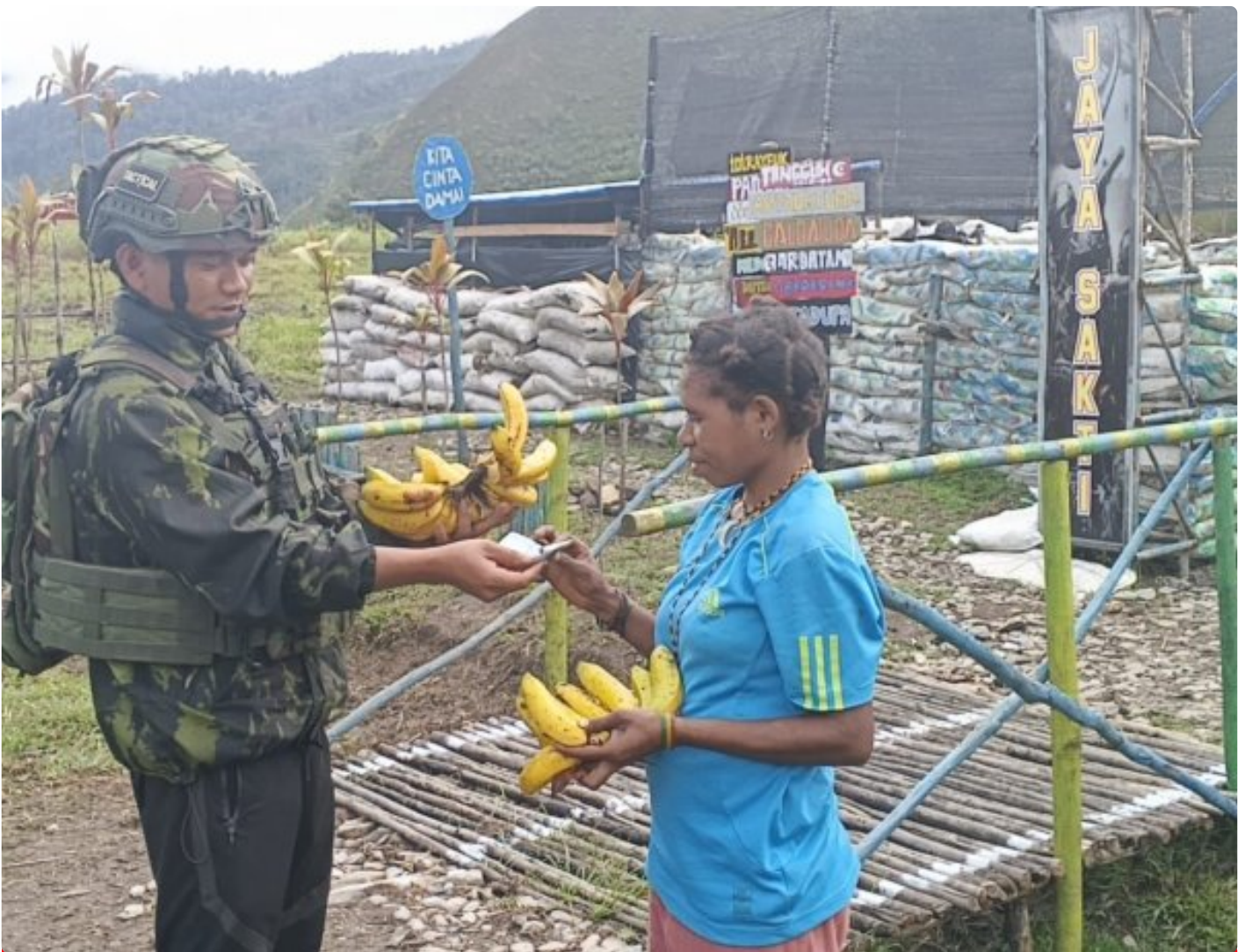
Foto: Prajurit Satgas Pamtas RI-PNG Mobile Yonif 113/Jaya Sakti (JS) Pos Bilai kembali menggelar program Borong Hasil Tani (Bohati) di Kampung Engganengga, Distrik Homeyo, Kabupaten Intan Jaya, Papua Tengah, Jumat (20/2/2026).

INTAN JAYA- Satgas Pamtas RI-PNG Mobile Yonif 113/Jaya Sakti (JS) Pos Bilai kembali menggelar program Borong Hasil Tani (Bohati) sebagai upaya mendukung perekonomian masyarakat pedalaman di Kampung Engganengga, Distrik Homeyo, Kabupaten Intan Jaya, Papua Tengah, Jumat (20/2/2026).